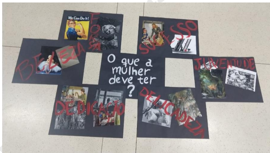
Figura 8: Sem título

Sobre o resultado das ações, as figuras foram ainda mais amassadas e rasgadas, sendo, então, realocadas em cartazes novamente acompanhadas das palavras escolhidas. Dessa vez, a aparência resultante foi mais agressiva, chamando mais atenção. Os cartazes foram expostos, no dia 12 de novembro de 2019, novamente no chão, acompanhados da frase “O que a mulher deve ter?”. Sendo assim, algumas pessoas continuaram a passar e pisar nas imagens, mas outras paravam para analisar.