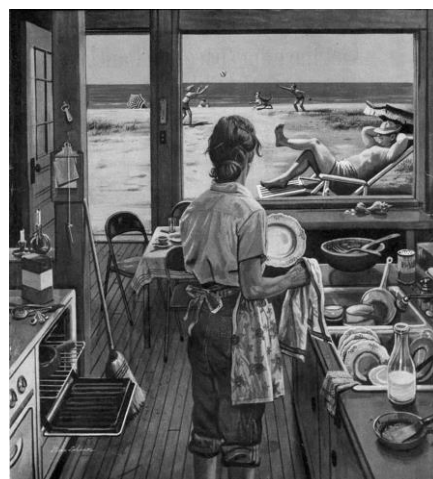
Figura 6: Lavando a louça na praia (Dohanos, 1952)

Os contrapontos foram pensados para que o espectador pudesse pensar no papel da mulher na sociedade, refletindo sobre aquilo que as mesmas lidam no dia a dia para alcançarem expectativas. As fotos em preto e branco, portanto, causam o choque por mostrar quase que cruamente a realidade, seja na dor física de uma bailarina, na pressão de se manter jovem, nos momentos que abdica para manter estruturada a casa e a família, nos obstáculos a mais que enfrenta no âmbito profissional ou no padrão de beleza que procura seguir. Tudo isso para que passe a imagem de mulher forte e íntegra, mesmo que ainda sofra violência muitas vezes não só social, mas física.