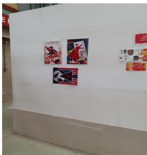
Figura 15: Sem título