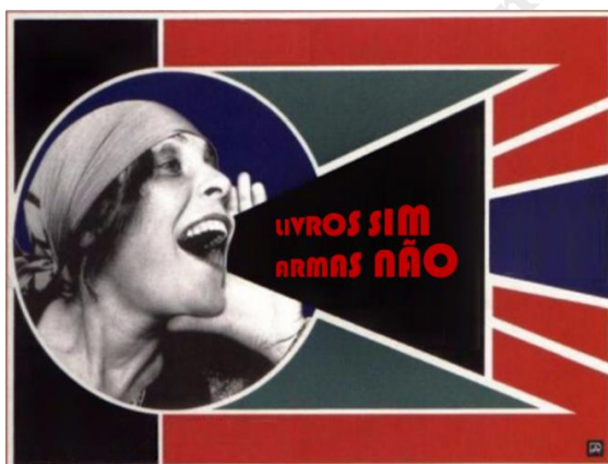
Figura 14: Sem título

Um segundo trabalho, “Sem Título” (2018), foi produzido a partir da pesquisa sobre arte social. Do estudo de alguns cartazes da antiga União Soviética, a maioria deles criados durante o momento crítico de guerra civil decorrente da Revolução Russa, inspirou para fazer releituras, dialogando com tema dessa investigação. Esses cartazes são grandes referências em luta e movimentos sociais, além de constituírem como evidências do pensamento artístico para uma forma popular de comunicação visual, pioneiros do design gráfico moderno. Assim, com influência nas utilizações dos cartazes como meio de comunicação, decidiu-se utilizar-se dessa forma crítica, contendo ironia nas releituras de cartazes russos. A exposição foi realizada no IFSP – Campus São Paulo.