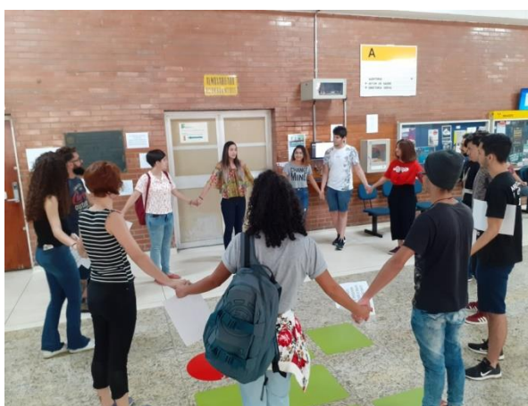
Figura 12: Ninguém solta a mão de ninguém

Campus São Paulo, foi proposta uma volta pelo local, sem direcionamento, logo, todas as pessoas participantes da roda, poderiam guiar. Cada participante recebeu uma folha sulfite com algumas frases impressas para que os provocassem a pensar sobre a proposta da performance.