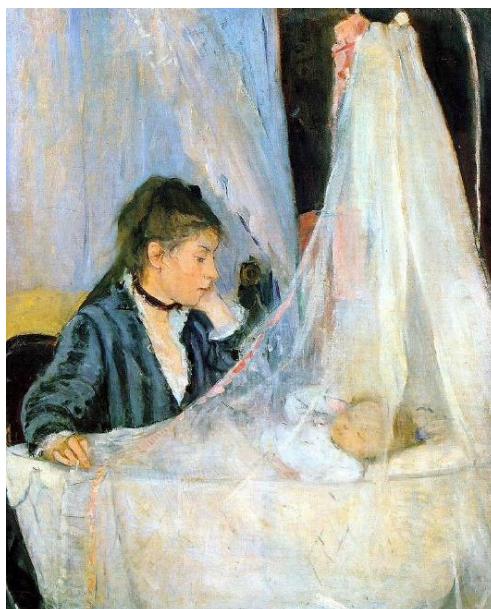
Figura 1: O Berço (Morisot, 1872)

Tendo como estudo o movimento impressionista no Brasil, verificou-se que seu desenvolvimento se deu de forma diferente, devido às condições de profunda transformação cultural no país ao longo do século XIX, sobretudo o advento da independência de Portugal e, mais tarde, da república. Ainda assim, pode-se resgatar alguns nomes que apresentaram as características pictóricas do Impressionismo, como Eliseu Visconti (1866-1944) e os irmãos Arthur Timótheo da Costa (1882-1922) e João Timótheo da Costa (1879-1932).