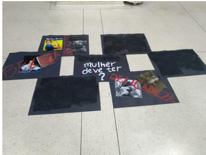
Figura 9: Sem título. Intervenção do dia 13 de novembro.