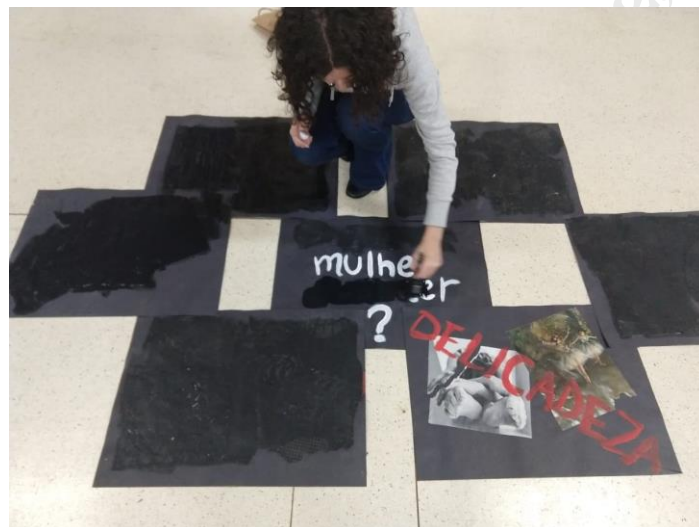
Figura 10: Sem título. Intervenção do dia 14 de novembro.