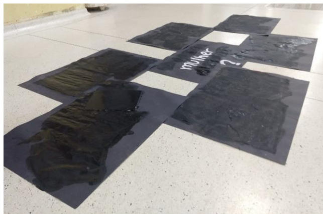
Figura 11: Sem título. Resultado da última intervenção.