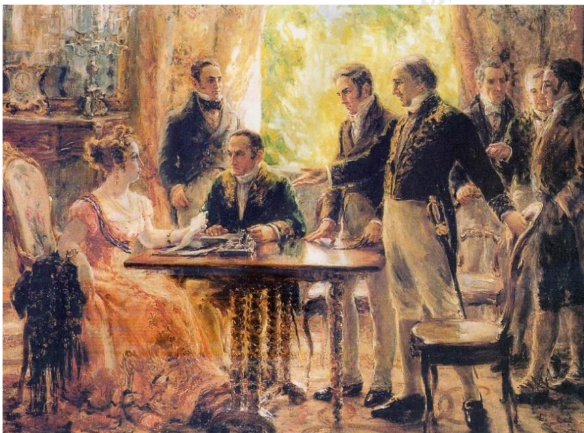
Figura 2: Sessão do Conselho de Estado (Albuquerque, 1922)

Um desafio duplo para os entendimentos da pintura histórica, pois além de ser pintado por uma mulher, tem outra como sua figura principal. Ao observar a obra, ainda, ficam perceptíveis as mesmas características antes atribuídas a Morisot. A preocupação com a representação pictórica da luz na obra de Albuquerque é evidente.