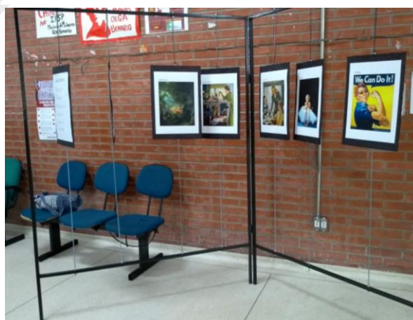
Figura 7: Mulher: Essência

A partir dessa etapa, para a concretização com obra artística própria, as duplas foram expostas em placas, com uma imagem em cada lado da mesma, de modo que para visualizar as duas, o espectador deveria interagir com a exposição e virar a placa.