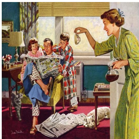
Figura 5: Detalhe de anúncio da Maxwell House (Mink, 1950)