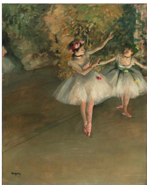
Figura 3: Duas bailarinas no palco (Degas, 1874)

trata de uma série de imagens agrupadas em duplas, de modo a criar um contraponto. Intitulado “Mulher: Essência” (2018), o trabalho busca imagens que representam o estereótipo da mulher, cada dupla com uma palavra a retratar. A ideia de contraponto se traduz na questão da “expectativa versus realidade”, ou seja, a primeira imagem remete àquilo que a sociedade espera da mulher, à visão ideal. Já a segunda retrata o que está por trás daquilo, a realidade na visão da própria mulher. Sendo assim, foram selecionadas duplas referentes às palavras: delicadeza, força, beleza, juventude, sucesso e dedicação. Representando a “delicadeza”, por exemplo, temos “Duas Bailarinas no Palco” (1874), de Edgar Degas, como o ideal, e a foto da fotógrafa russa Darian Volkova, como o real.