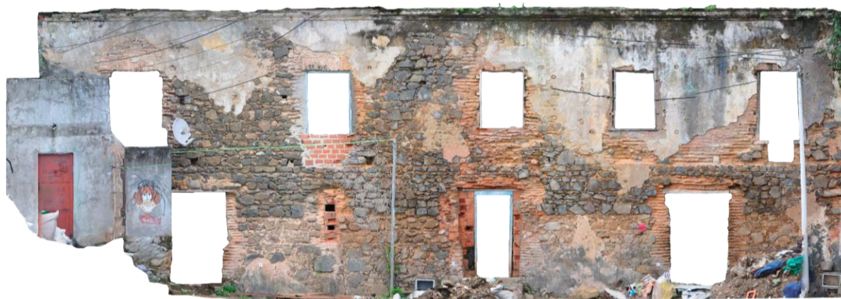
Imagem da fachada frontal do casarão, gerada por fotogrametria