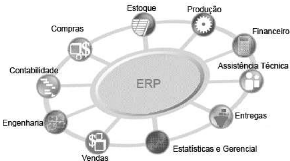
Figura 2 - Interação entre as áreas