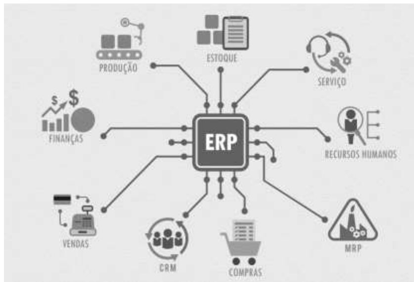
Figura 1 - ERP