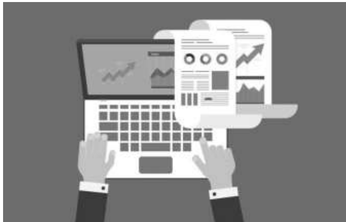
Figura 3 - Estoque informatizado